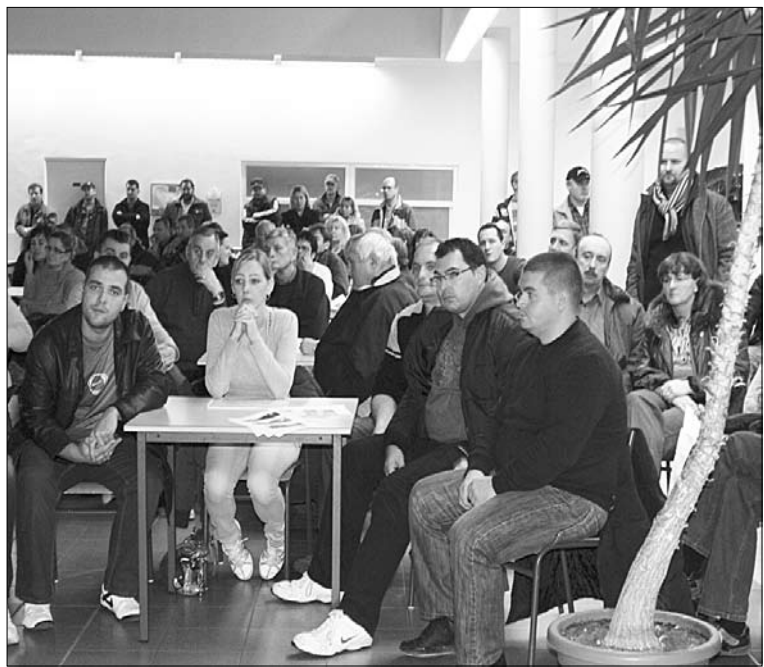
Obyvateľov sídliska Juh sa stretlo neúrekom.

očakávajú predloženie ďalších variantných riešení vzniknutej situácie. Mestský úrad uznesením zaviazali do konca januára predložiť komplexne rozpracované alternatívy riešenia vzniknutej situácie tak, aby poslanci dostali na rozhodnutie úplný materiál s potrebnými prílohami.