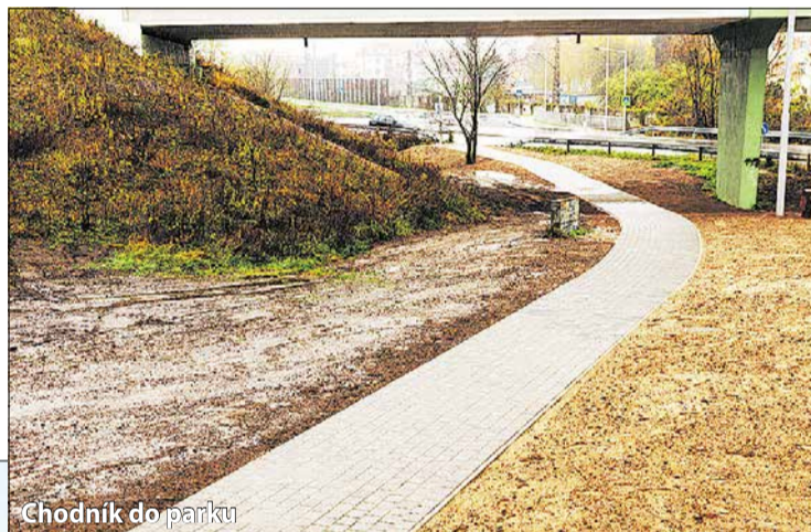
Chodník do parku