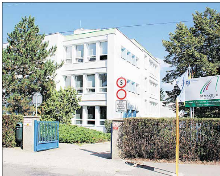
Text: Gymnázium Malacký

Zahraničný partner programu zabezpečuje kontinuálne vzdelávanie vedenia školy a učiteľov nemčiny, ktorí sa na príprave žiakov pre DSD podieľajú. Okrem toho zabezpečuje kontakty s nemeckými a rakúskymi inštitúciami a podnikmi. Malacké gymnázium je zaradené do celosvetovej siete škôl, ktoré realizujú vzdelávací program DSD, od roku 2010.