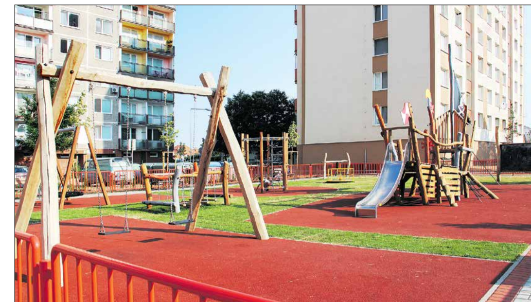
Revitalizácia zóny Juh