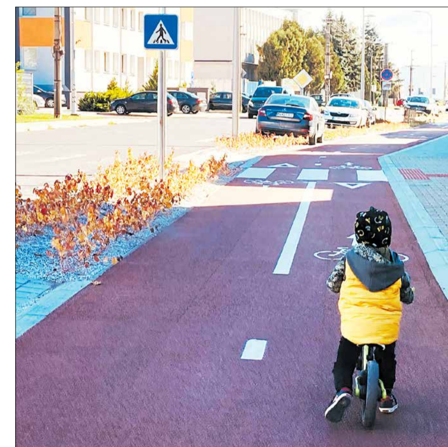
Cyklotrasa Pezinská – priemyselný park