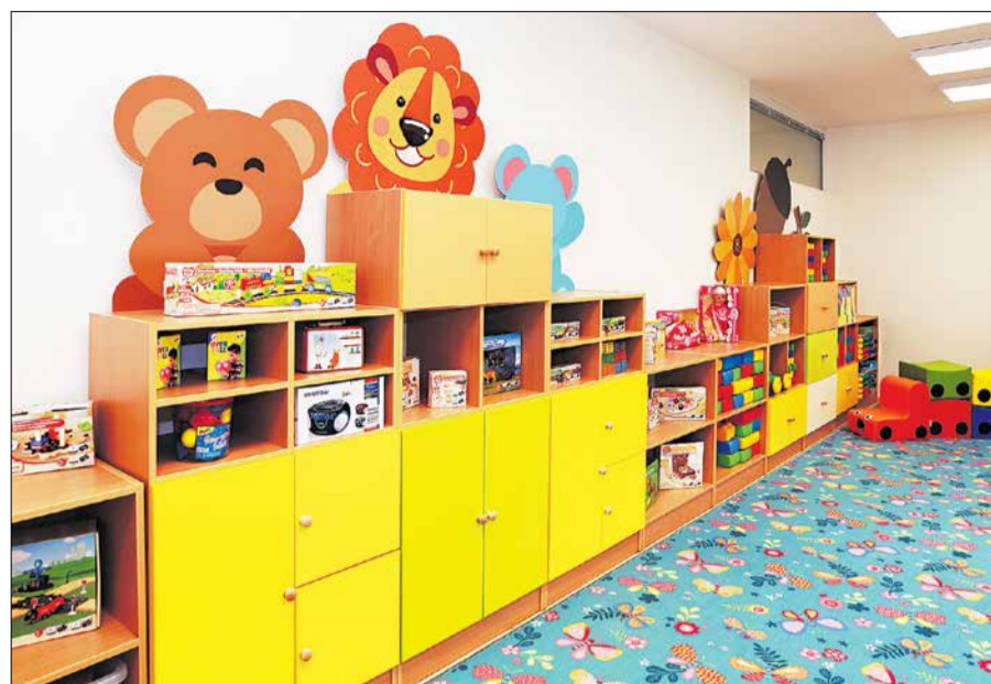
Nová trieda materskej školy na Záhoráčke

Prípravila L. Pilzová v spolupráci s Útvorom strategického rozvoja MsÚ Malacký