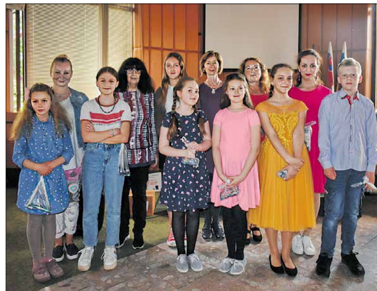
Seniorom zo Zlatého veku zahráli a zaspievali deti z CVČ