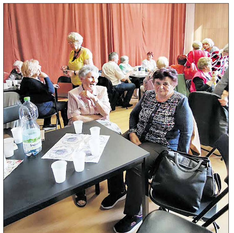
Deň matiek v Dennom centre

aj milé prekvapenie. Schôdzu prišli pozdraviť mladí umelci z centra voľného času, ktorí sa predstavili spevom a hrou na klavír. Za pekné vy-