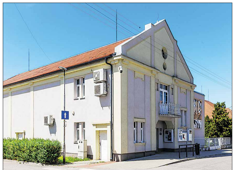
Kino s novou strechou