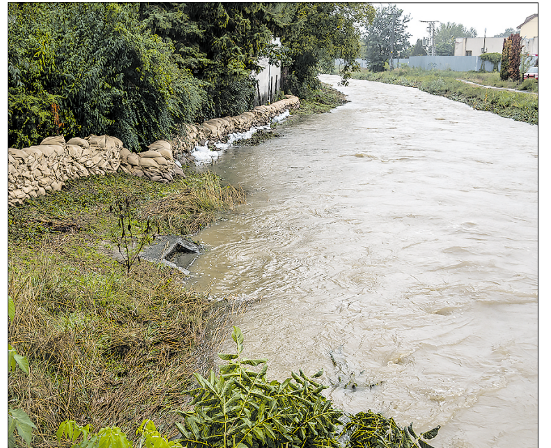
Malina na Štúrovej, 16. septembra 2024