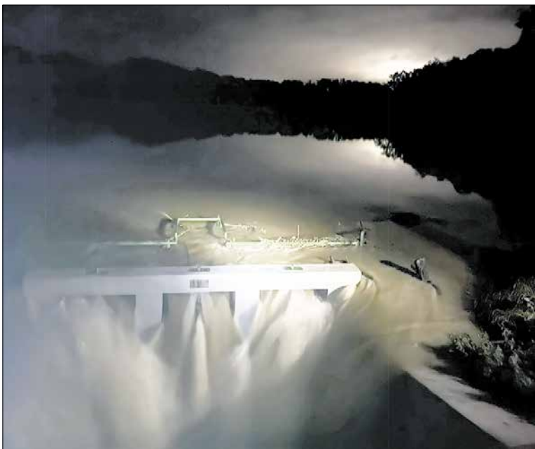
Trojka rybník, večer 15. septembra 2024