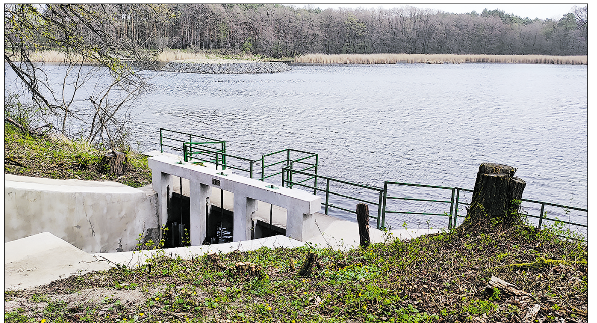
Trojka rybník počas bežných dní, apríl 2024