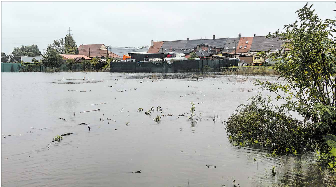
Vinohrádok, 15. septembra 2024