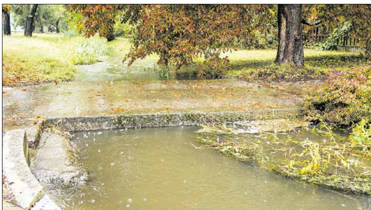
Malina, Pri mlyne, 15. septembra 2024