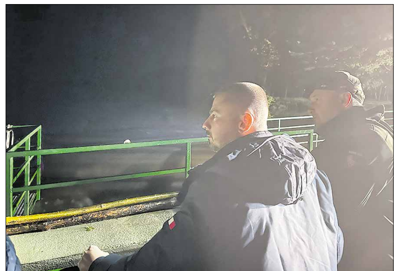
Primátor Juraj Říha v teréne, večer 15. septembra 2024