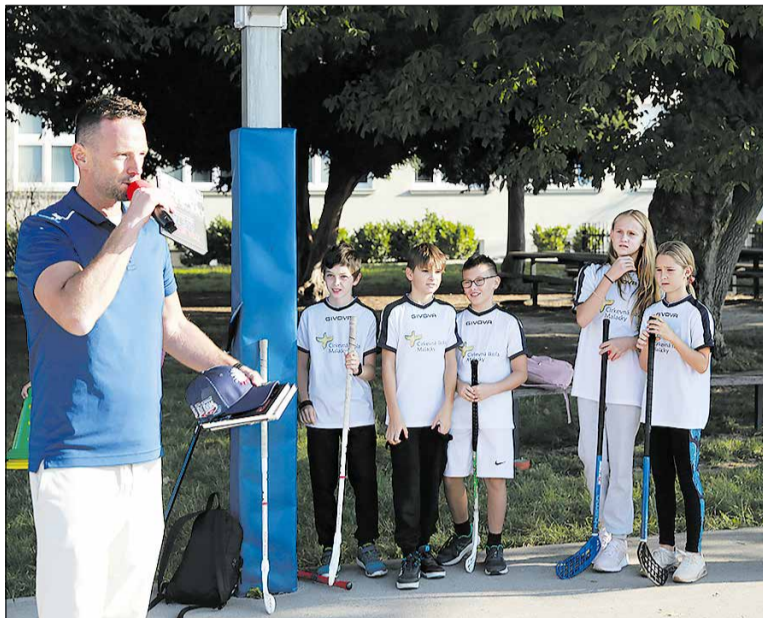
Bývalý hokejista, majster sveta z roku 2002 Richard „Citrón“ Lintner prišiel povzbudiť žiakov pri športových aktivitách a neskôr s nimi viedol zaujímavú diskusiu.

V piatok 20. septembra sa na školskom ihrisku Spojenej školy sv. Františka Assiského v Malackách konalo už tradičné podujatie Cirkevná v pohybe , ktoré bolo venované žiakom 2. až 6. ročníka základnej školy. Cieľom akcie bolo podporiť zdravý životný štýl a pohybové aktivity medzi deťmi. Tak ako v predošlých rokoch, aj tento raz pozvali organizátori zaujímavého hosta z oblasti športu.