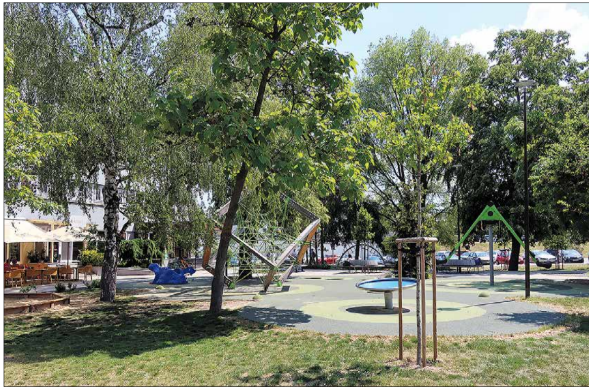
Ihrisko pred ŠH Malina