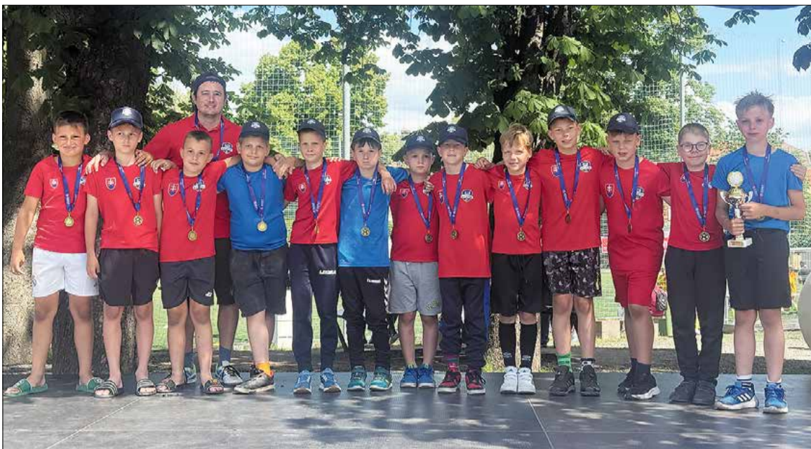
Chlapci z kategórie U10