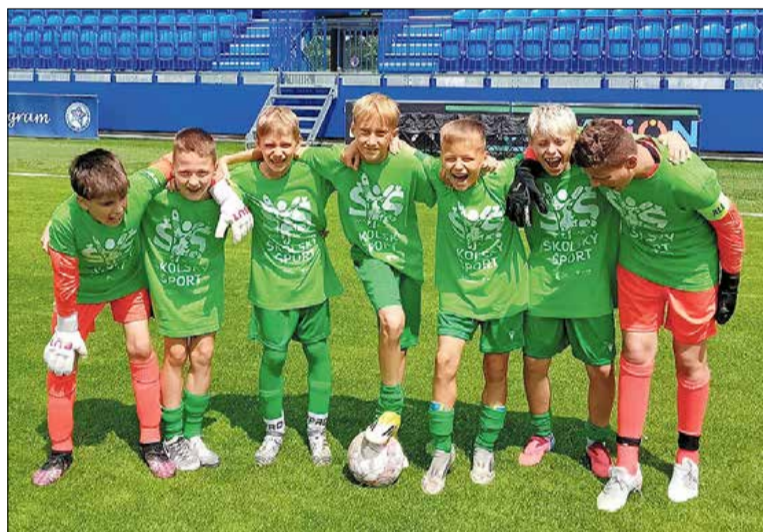
Futbalisti ZŠ Záhorácka – celoslovenské superfinále

Text: -mb-/jh-, foto: ZŠ Záhorácka/FC Žolík Malacky