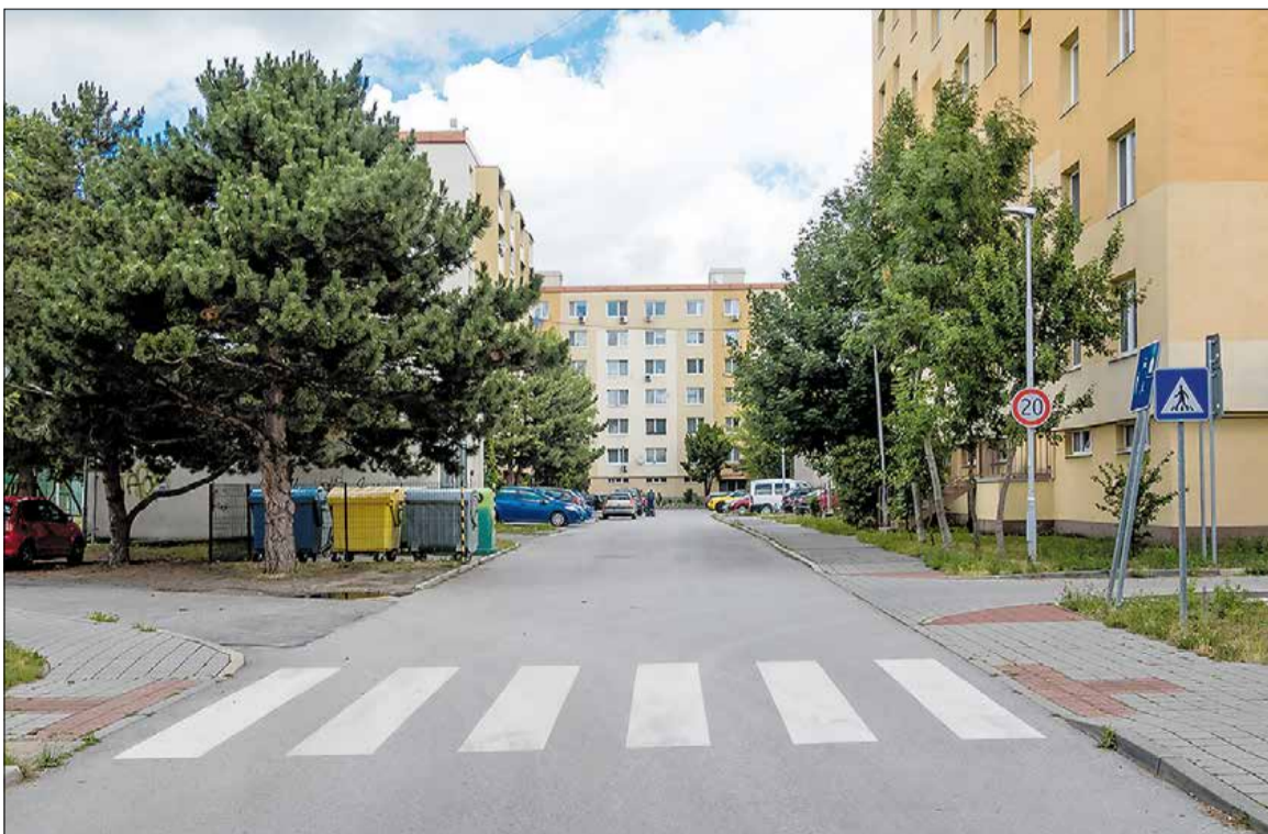
Ulica M. Rázusa

mestím a priestrannosťou na stretávanie ľudí je dobrým ťahom, ako prinášať „život“ priamo do stredu mesta. Kultúrnymi a spoločenskými aktivitami sa môže vytvárať zdravá mestská komunita.