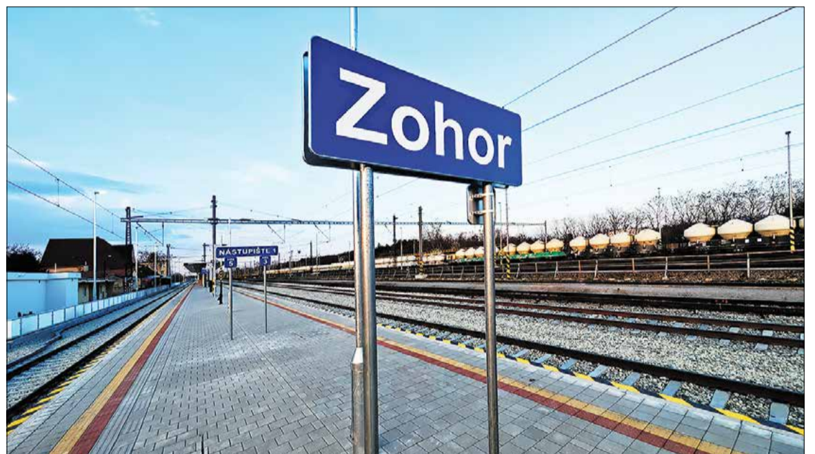
Železničná stanica v Malacách bude po dokončení projektu vyzerať podobne ako aktuálne zrekonštruovaná stanica v Zohore.