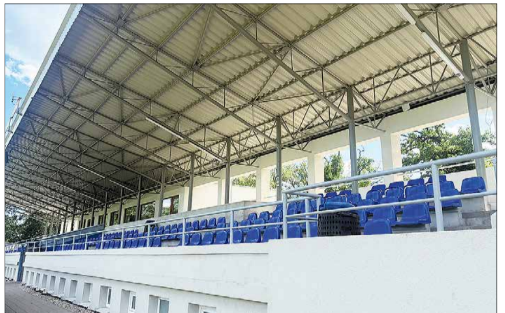
Zrekonštruovaná tribúna na futbalovom ihrisku v Zámockom parku