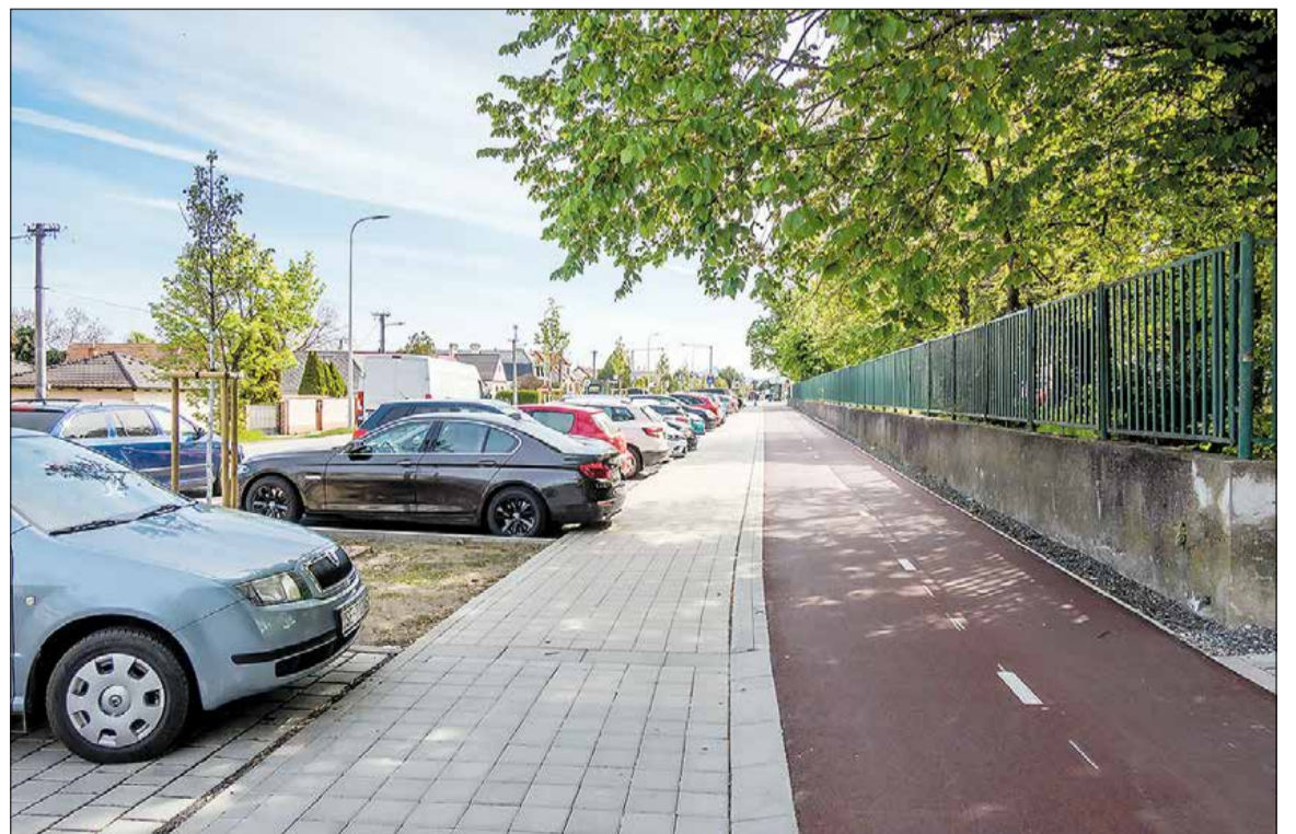
Cyklotrasa na Duklianskych hrdinov