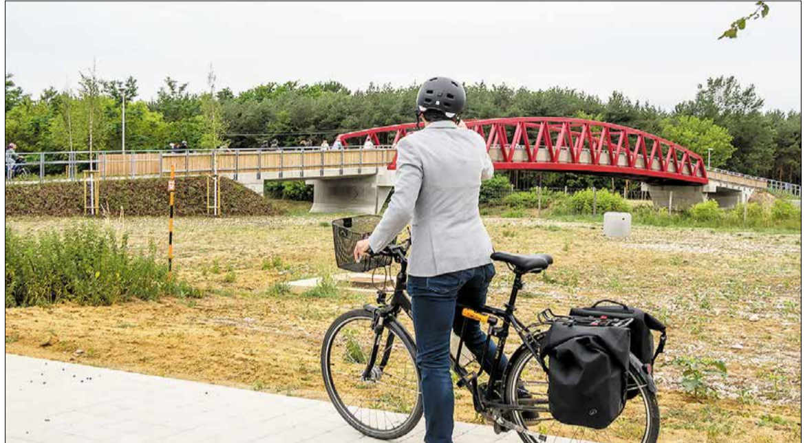
Lávka pre chodcov a cyklistov ponad D2