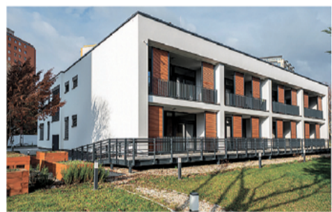
Centrum sociálnych služieb na Strelkovej v Rači

V oblasti školstva sa BSK podarilo vyrokovať viac ako 100 miliónov eur na rozšírenie kapacít materských a základných škôl. V kraji pribudlo 355 nových tried základných škôl a 2 862 miest v materských školách. Veľké investície smerovali aj do modernizácie stredných odborných škôl, športovísk a telocviční. Významnými projektmi boli