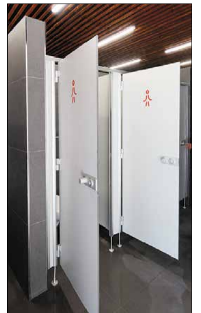
Nové zázemie na kúpalisku

Aktuálne sa začala rekonštrukcia nádvorí kaštiela s kaplnkou a vnútornou fasádou. Za náš 6. obvod sa nám podarilo dať do nového šatu celú Partizánsku ulicu spolu s novou cyklotrasou. Teším sa, že naďalej nezabúdame ani na naše školy a škôlky a ich modernizácia pokračuje. Nesmieme zabudnúť ani novú kompostáreň, ktorá nám tu veľmi