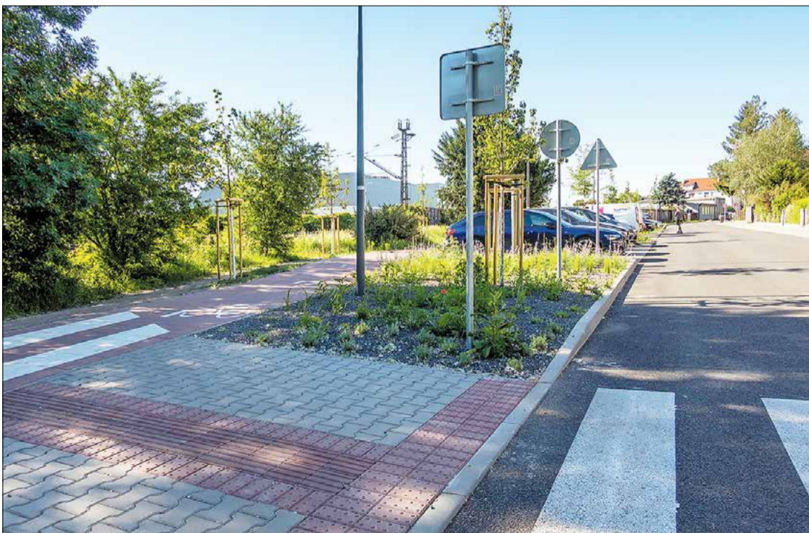
Cyklotrasa na Partizánskej

Otvorili sme Šport arénu, čiastočne sme zrekonštruovali futbalový štadión a kúpalisko. Získali sme zdroje pre kaštieľ a vyprojetovali novú školu i centrum pre autistov. Mimo šiesteho obvodu ma najviac teší, že výstavbou Námestia u Severínka sme dokázali vrátiť život priamo do srdca mesta.