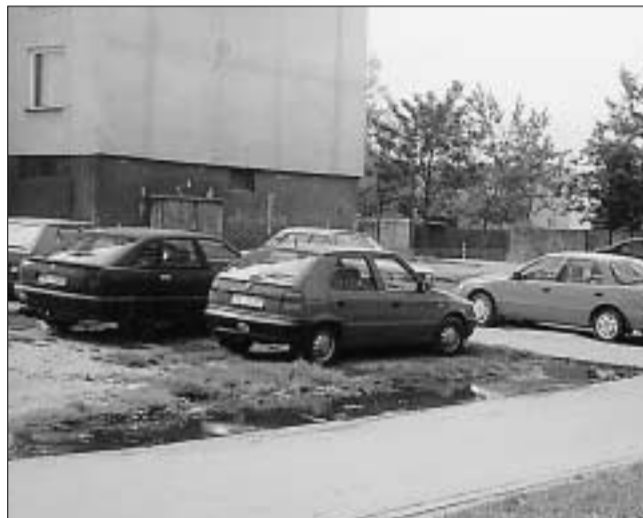
Na Záhoráckej ulici sa parkuje všade, trávnik nevnímajú.

Aj na tejto ploche sa ešte nedávno veselo parkovalo. Dnes opäť patrí deťom a milovníkom zelene.