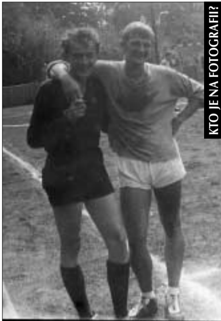
... a z hráča sa stal rozhodca (rok 1969).

Radi sa pozeráte na vlastnú fotografiu z detstva, manželovu z vojenčiny alebo detí z pionierskeho tábora? Neváhajte, pošlite či prineste nám ju do redakcie (nepoškodená sa vám vráti naspäť). Oživte si spomienky s Malackým hlasom.