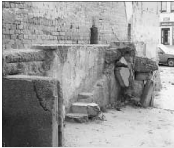
Ruiny z druhej svetovej? Nie, centrum mesta Malacky.

že trávniky pod oknami sú opäť trávnikmi. Pozitívom je aj fakt, že na stavbe polyfunkčného domu na Záhoráckej ulici znovu vládne čulý ruch a tento doposiaľ strašák mesta sa čoskoro premení na účelný objekt.