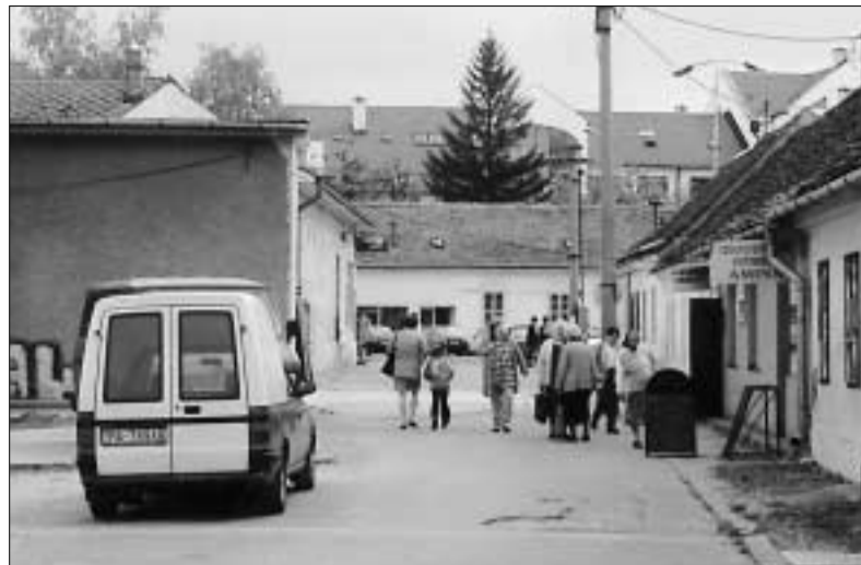
Uvoľnením a vyčistením priestoru vznikla plocha pripomínajúca pešiu zónu. Čo by mala činia za ňu dali...

Stranu pripravila IVANA POTOČNÁKOVÁ Za spoluprácu ďakujeme DALIMÍROVI TEKELOVI