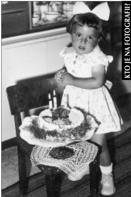
KTO JE NA FOTOGRAFII?

Tešíme sa aj na fotografie z vašich rodinných albumov. Zalistujte v nich a pošlite, prineste alebo vhodte do schránky na budove MsÚ svoj príspevok do rubriky Uhádnite, kto je na fotografii?