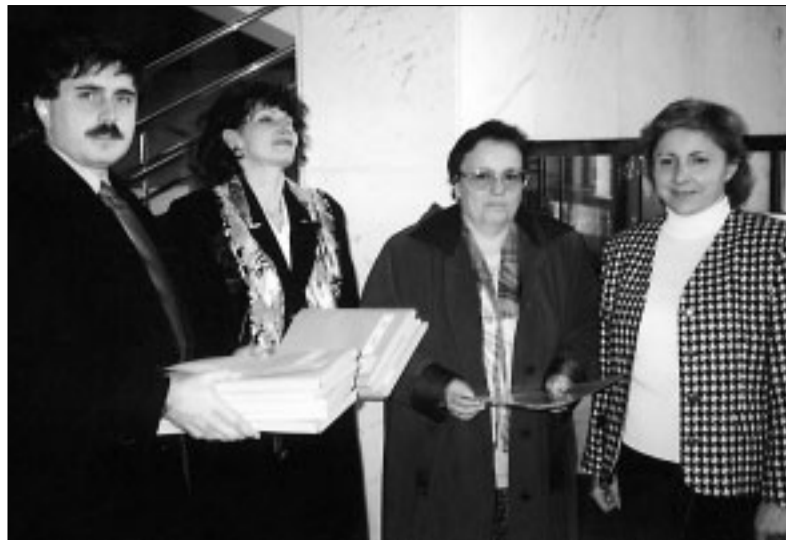
December 1999 – petičný výbor odovzdáva v Národnej rade Slovenskej republiky petičné háčky s podpismi šesťnásťtisíc obyvateľov okresu Malacky. Nemocnicu si nedáme.

V skorej diagnostike onkologických ochorení vo všeobecnosti majú veľký význam zobrazovacie metódy, na základe ktorých vedú odborníci potvrdiť alebo vylúčiť prítomnosť primárneho nádora, určiť jeho lokalizáciu, veľkosť a štruktúru a v pozitívnych prípadoch zistiť celkový rozsah choroby vo vzťahu k iným orgánovým systémom.