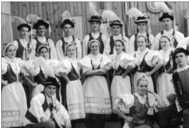
Tretia skupina folklórného súboru Slnecnica-Sunečník.