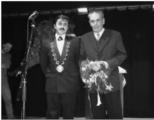
Lekár, vedec, pedagóg, žijúca legenda slovenskej geriatrickej L. Hegy je v súčasnosti docentom na Katedre medicínskej pedagogiky Slovenskej postgraduálnej akadémie medicíny v Bratislave.