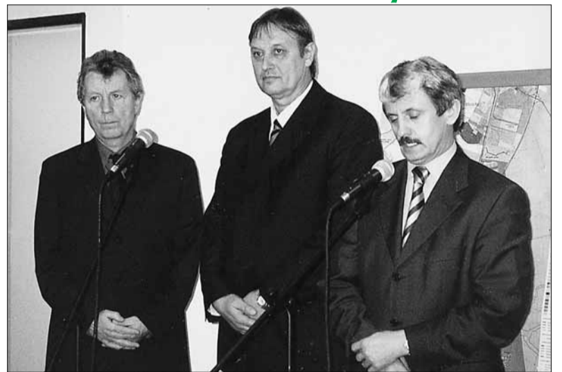
M. Dzurinda: „Tam, kde budem vedieť byť užitočný, budem sa usilovať užitočný byť.“