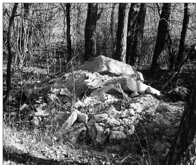
Aj takto si niekto predstavuje likvidáciu stavebného odpadu (Továrenská ul.).

IVANA POTOČŇÁKOVÁ foto: autorka Za spoluprácu ďakujeme Ing. Františkovi Illému