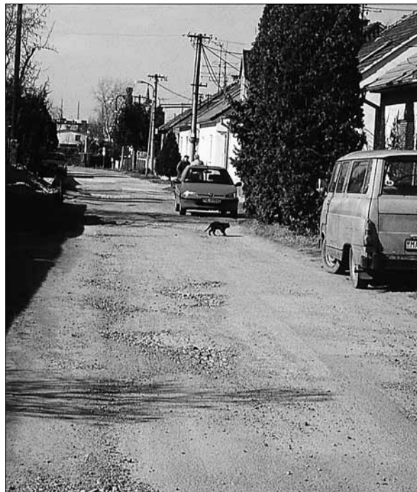
Stará Sadová má komunikáciu v hroznom stave. A ešte vám prebehne aj čierne mačka cez cestu...

Netreba chodiť ďaleko a zdevastovaný kus záhorskej zeme nájdeme aj pod nadjazdom (foto vpravo). Výstavba supermarketu viazne a lokalita Na brehu je stále centrom neporiadku a doslova verejnou čiernou skládkou odpadu. Cez víkendy sa športová hala Malina teší hojnej návšteve Bratislavčanov, ktorí ju využívajú na aktívne využitie voľného času a športovanie. Ktovie, akú mienku si hneď po prvej návšteve urobia o našom meste, keď zaparkujú ved-