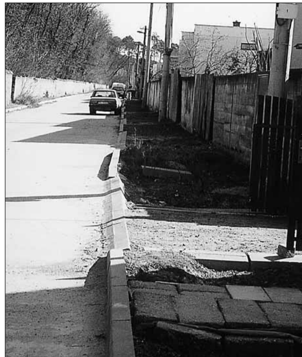
...na novej Sadovej je položený betónový kryt. Chybičkou krásy je nedokončený chodník.