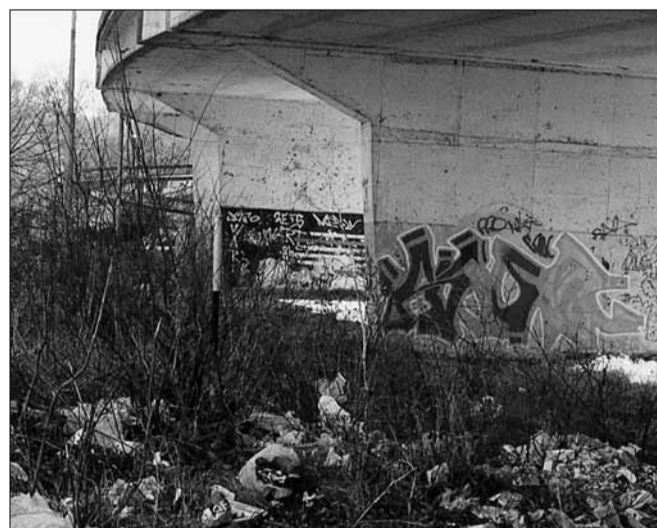
Zákony? Vézetenká? Načo – my si budeme sypať odpad, kam chceme! Trebárs aj do samého stredu mesta, nech produkty našich domácností vidí každá posádka každého auta prechádzajúceho nadjazdom.