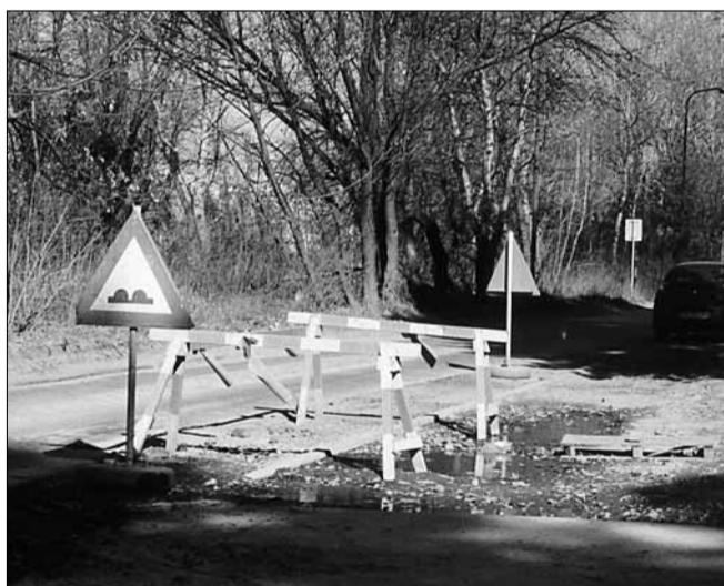
Úzka komunikácia komplikuje prejazd kamiónom na ceste do priemyselnej zóny. Vrásky na tvárach vodičom pridáva aj takéto nechcené zúženie, ktoré cestu „zdobí“ už niekoľko dní. (Továrenská ul.)