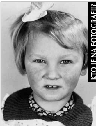
KTO JE NA FOTOGRAFII?

Tešíme sa aj na fotografie z vašich rodinných albumov. Zalistujte v nich a čo nájdete, pošlite, prineste alebo vhodte do schránky na budove MsÚ. Pomôžete tak tvoriť rubriku Uhádnite, kto je na fotografii?