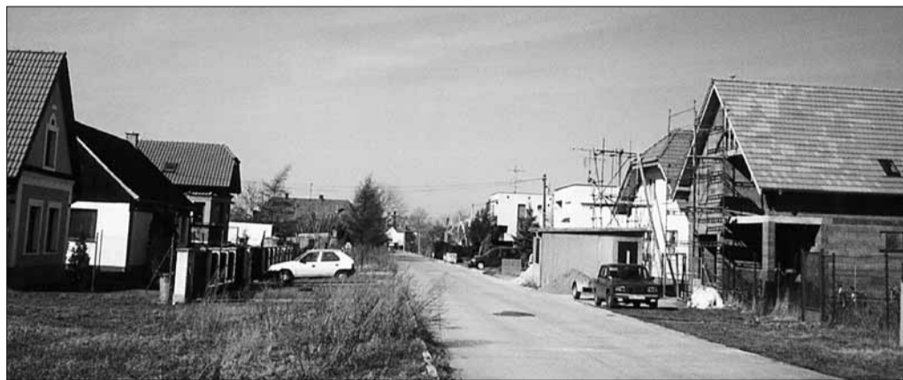
Zo Záhradnej sa stáva pekná tichá ulica s individuálnou bytovou výstavbou.