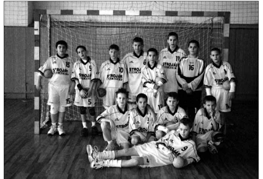
Malacká hádzaná sa o budúcnosť obávať nemusí.