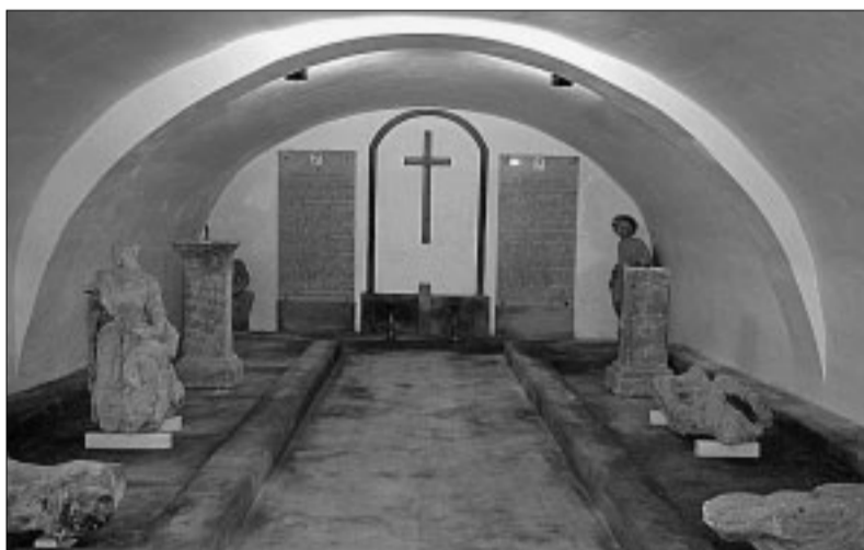
Kláštorné podzemie je od 5. júla sprístupnené verejnosti. Objavili sa už a hojne ho navštevujú turisti.

Kúpime ornú pôdu, resp. jednoduchý nezastavaný pozemok 5-10 ha. Max. 80 km od Bratislavy. Tel.: 0904 863 885