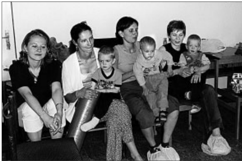
Tvorivé dielne, hry, divadielko, prednášky. To všetko nájdú v detskom centre Vánok jeho malí i veľkí návštevníci.

Naši najmenší potrebujú stále nové impulzy. Na stretnutiach v malackom DC o ne nie je núdza.