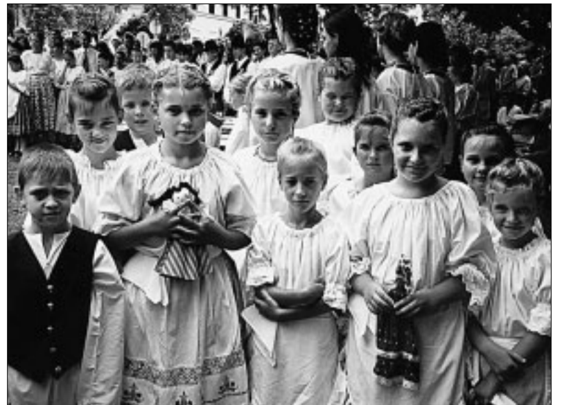
Slovenské deti žijúce v Sarvaši (Maďarsko) sa vo svojom kultúrnom programe prihovárli hosťom: „Naši predkovia prišli z vašej krajiny. My už len z rozprávania vieme, že ich šikovné ruky ručne šili čizmy, pletli košíky, obrábali úrodnú pôdu. Aj nás vábi krajina pod Tatrami. Sme hrdí na to, že sme Slováci.“