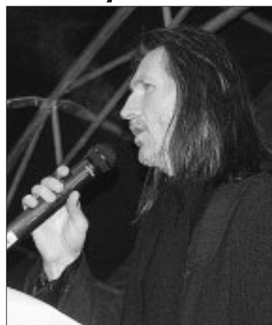
nočný koncert Strany 156 a vystúpenie skupiny Vega. A potom už: šťastné a veselé Vianoce!

V poslednú adventnú nedeľu 22. decembra o 17.00 h na nás na Malom námestí čaká Jezuliatko – Betlehemska hra v podaní divadelného súboru Orbis, via-