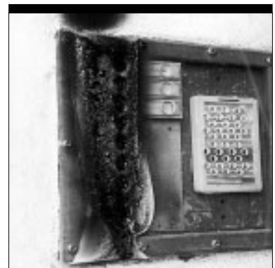
Komu mohlo spôsobiť radosť, že narobil starosti a nepríjemnosti majiteľom bytov na Bernolákovej ulici číslo 14? Ráno 18. novembra našli pri vchodových dverách vypálené zvončeky i automatického „vrátnika“. Dvanástim rodinám nezostalo iné, len poskladať stovku k stovke a kúpiť nové zariadenie. Nestáli však krútiť hlavami a čudovať sa: komu prekážali ich fungujúce zvončeky? text a foto: –ipo–