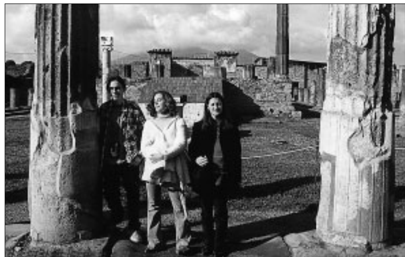
Slovenskí študenti majú zo svojho pôsobenia v Taliansku veľmi dobrý pocit a dúfajú, že hlavná myšlienka projektu Exposcuola – spájať ľudí – bola naplnená. Zároveň veria, že aj Malačania budú dobrými hosťami, keď príde talianska delegácia na Slovensko.

Očistené, uvarené zemiaky ocedíme a zasypeme múkou. Vareskou urobíme do zemiakov cez múku otvory, aby para mohla dobre unikať a zakryté necháme stáť asi 10 minút. Potom vareskou rozotrieme zemiaky s múkou na hladké cesto. Lyžicu namáčame do rozpusteneho tuku a pomocou varešky vtlačáme do nej zemiakové cesto, ktoré vyklopujeme na misu. Šklbanky posypeme mletým makom a cukrom, môžeme ich aj v horúcom tuku vyprážať.