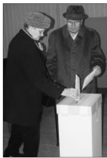
Pre staršiu generáciu je možnosť zúčastniť sa volieb ctou. Aj 6.–7. decembra pristúpilo k volebným urnám v Malackách najväčšie percento seniorov.

31 %-ná účasť voličov, primátorom Ondrejka, 8 nových poslancov