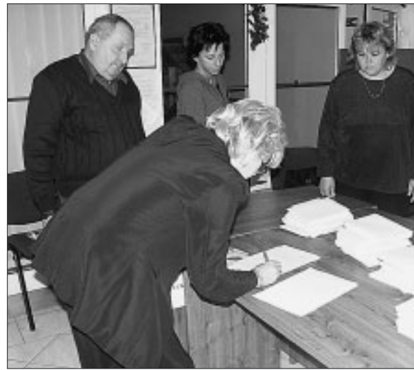
V sobotu 7. decembra po 14.00 h nastala krušná a zodpovedná chvíľa pre jednotlivé okrskové volebné komisie. Sčítajú všetky hlasovacie lístky a oznámia mestskej volebnej komisii výsledok sa im podarilo v krátkom čase.