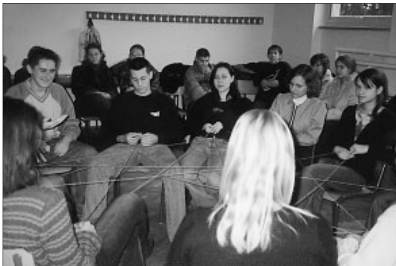
Na Mikuláša pozvalo Gymnázium v Malackách žiakov a rodičov na tradičný deň otvorených dverí. Ponuka bola naozaj bohatá – okrem ukážkových hodín v špecializovaných učebniach sa veľkej pozornosti tešilo novotvorené kino! Na snímke druháci na hodine etickej výchovy tvoria hviezdú priateľstva. Za pomoci kľbka špagátu a viet typu: „mám ťa rád, lebo dobre hráš volejbal“ či „vážim si ťa, lebo si vždy ochotná pomôcť“ nazreli do hĺbin svojich študentských duší.