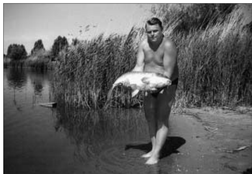
Aj takéto kusy plávajú v záhorských vodách.