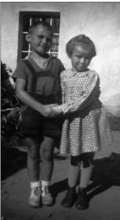
Svetlovlasej slečne koluje v žilách šľachtická krv.

Na výhercu čaká sladká odmena z cukrárne Dobrotka.