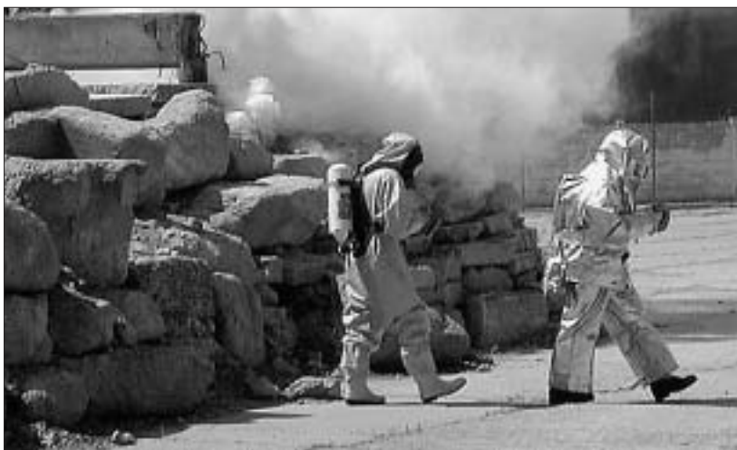
Príslušníci záchrannej brigády Hasičského a záchraného zboru v Malackách prechádzajú permanentným výcvikom. Bodaj by nemuseli zasahovať „naostro“...

Pre obyvateľstvo mesta Malacky máme pripravených dostatok prostriedkov individuálnej ochrany, a to v troch lokalitách mesta. Máme ochranné rúška OR-1, detské ochranné masky DM-1 (líčnice s filtrami a kapsami), ochranné masky CM-3, ochranné masky CM-4 (líčnice s filtrami a kapsami) i ďalšie prostriedky na osobnú ochranu. Možnosť ukrytia sa rieši umiestnením v ochranných stavbách rôznych druhov a typov (odolné, plavotesné úkryty, jednoduché úkryty budované svojpomocne, chránené pracoviská). Keďže odolných a plavotesných úkrytov v celoštátnom meradle je ne-