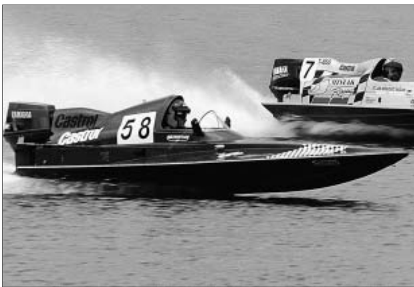
Vodní motoristi sú pýchou malackého športu