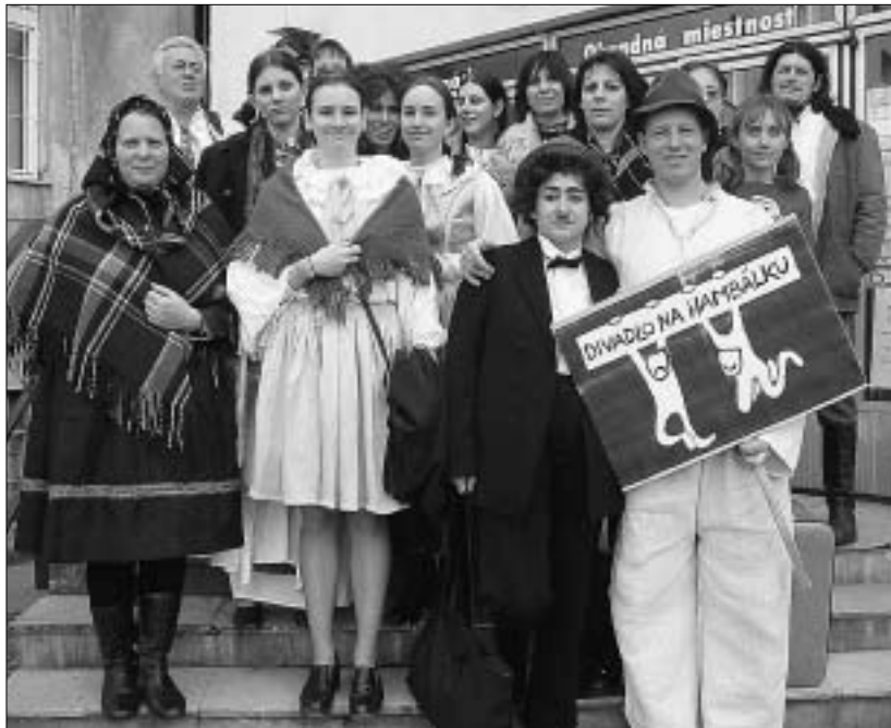
O tom, že v Malackách sa hrá výborné ochotnícke divadlo, vedia už aj za hranicami mesta a regiónu. Divadlo na hambálku sa však nezatvára len medzi štyri steny spoločenskej sály - ochotne zostupuje z dosiek, ktoré znamenajú svet a plným priehŕstím ľuďom rozdáva životnú energiu na uliciach a námestiach. (Čítajte pod titulkom Fašiangy s Divadlom na hambálku.)