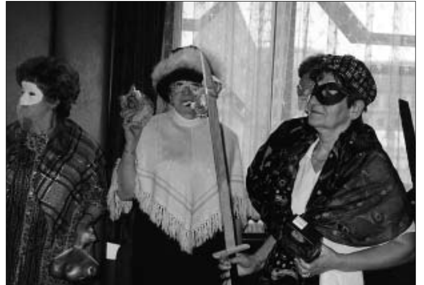
Fašiangy, Turíce, Veľká noc príde... Malackí dôchodcovia sa s fašiangmi rozlúčili veselou spevom a tancom.