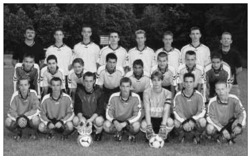
Chlapci, ktorí vybojovali pre Malacky II. ligu.

dorastenci, ktorí taktiež vyhrali svoju skupinu III. ligy s jedenásťbodovým náskokom. Pokračovanie na 6. strane