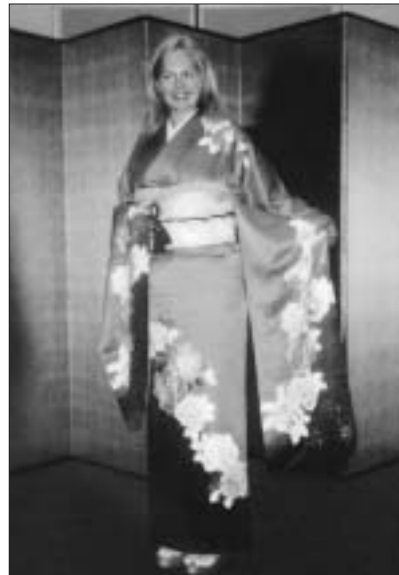
Slávnostné kimono svedčí nielen nízkym čiernovlasým Japonkám, ale aj vysokým plavovlasým Slovenkám.

Delegácia z Malaciek absolvovala aj jazdu superrýchlym šinkanzenom na ceste do nukleárnej elektrárne. Japonci si nepodávajú ruky. Osobné pozdravy riešia úctivým uklonením. Takto sa aj lúčili s plynármi celého sveta. Tí si budú aj navždy pamätať krajinu, v ktorej je čistejšie než čisto... IVANA POTOČNÁKOVÁ