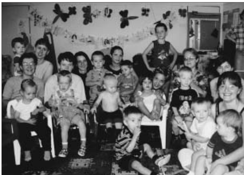
Práca s kamienkami, pieskom a temperami – budúci škôlkari strávili vo Vánku týždeň plný hier.

Akcia, ktorú pre deti pripravili mamičky, sa konala v dňoch 25. až 28. augusta v priestoroch Vánku na Ul. M. Rázusa