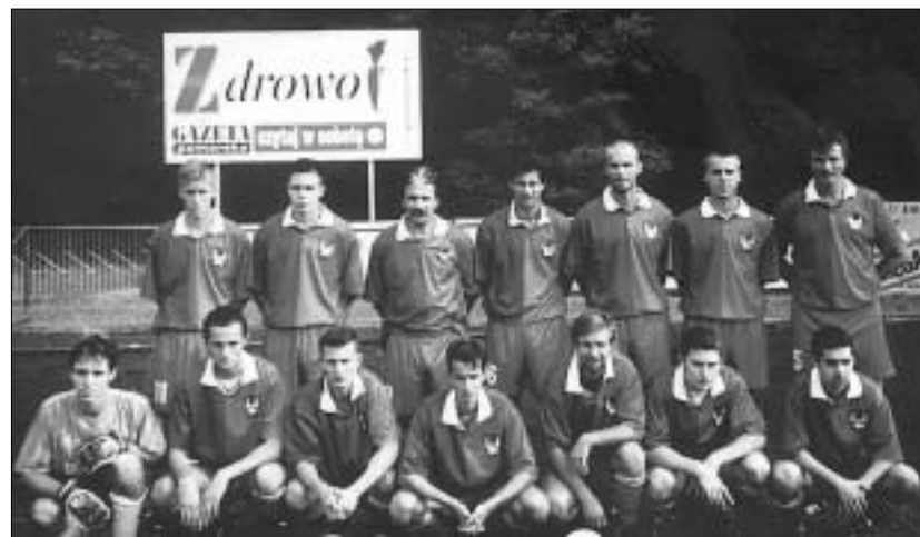
Futbalisti ŠK Malacky pred posledným zápasom na turnaji.