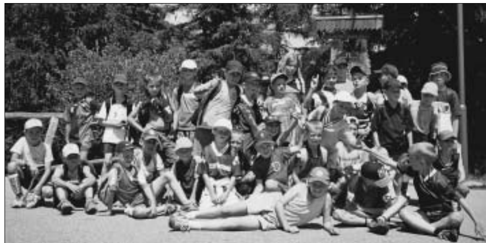
Tréningy, túry a čistý tatranský vzduch si futbalové nádeje zo ŠK Žolík užívali na začiatku prázdnin.