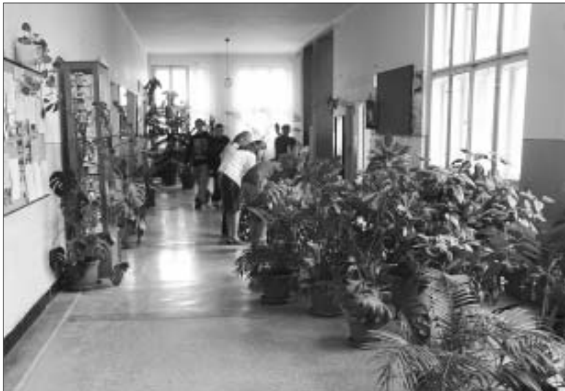
Statik nariadil evakuovať životonebezpečné priestory školy. Chodby školy sa na chvíľu premenili na botanickú záhradu.

rozhodol o maximálnom možnom príspevku na rekonštrukciu vo výške 200 tisíc korún. „Prijmeme skutočne každú pomoc,“ hovorí riaditeľka. Primátor mesta predložil mestskému zastupiteľstvu návrh, aby mesto uhradilo rekonštrukciu v plnej výške. V ZŠ M. Olšovského sa do konca roka, kedy by mala byť rekonštrukcia ukončená, bude vyučovať v provizórnych priestoroch – v jedálni, v byte po školníckovi i na fare. -ipo-