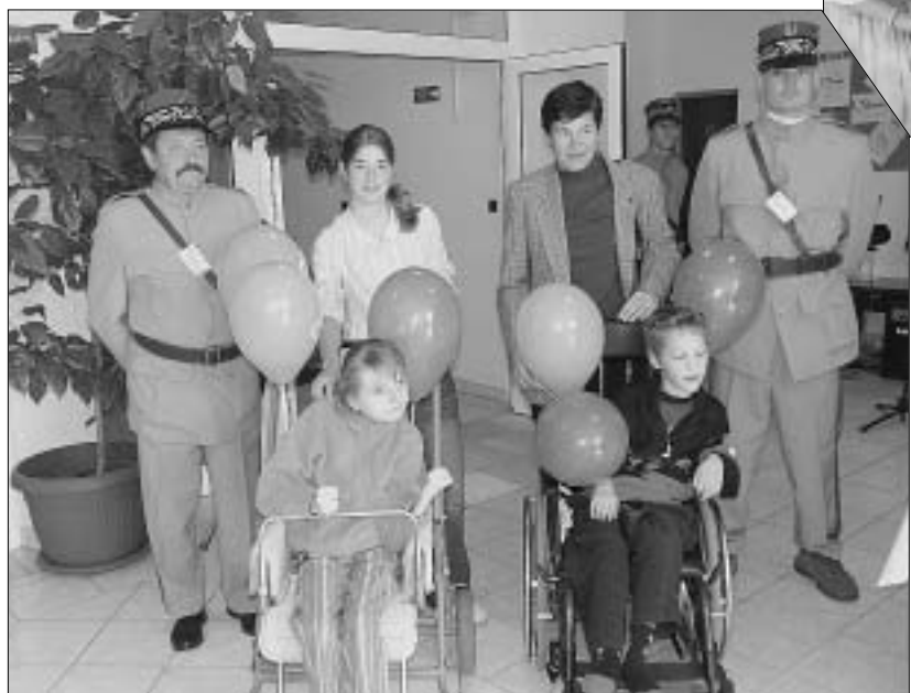
Hasiči v replikách uniform leteckého generála z čias 1. svetovej vojny (tzv. „štetánikových uniformách“) držali čestnú stráž pri vstupe do úradu i dverách primátora mesta. Vzbudovali všeobecnú pozornosť a úctu. Páčili sa aj deťom z Domu Svitania, ktoré sa potesili balónikom s logom mesta.