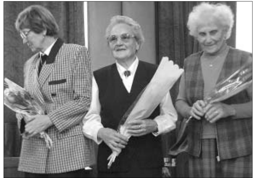
„Osemdesiat babička má, oslavuje rodina. Pridávame naše pranie: nech je zdravá, spokojná,“ takýmto želaním pozdravili seniori jubilujúce členky JDS.