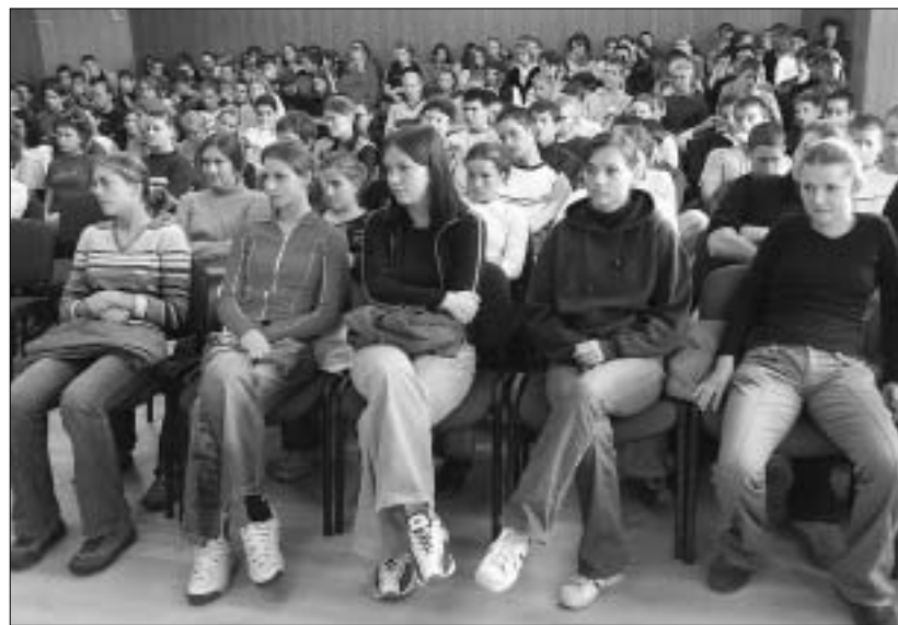
Chvilkami, najmä pri slovách o prežitom pekle, bolo v sále hrobové ticho.