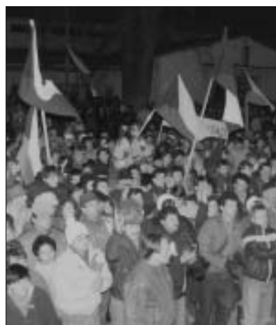
To je ono! V jednote je sila! Pamätníci ešte dnes počujú ozvenu revolučných dní. Výkriky sa ozývali aj Zámocký park v Malackách. Skrehnuté ruky štrngajúce kľúčami a mohutné hlasy vyhánali neslobodu. O niekoľko dní tomu bude štrnásť rokov. Čo o 17. novembri 1989 vedia tí, ktorí v tom čase stáli veže z detských kociek – dnešní študenti? Čítajte anketu na tejto strane.