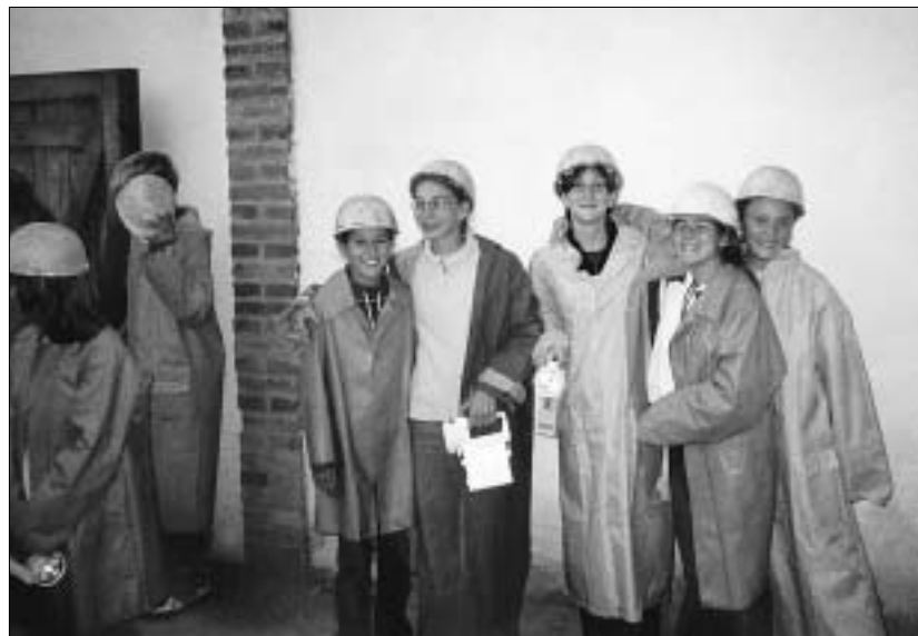
Ôsmaci zo ZŠ Záhorácka 95 v Malackách sfárali na dno bane Bartolomej ako ozajstní baníci.

Nie každá škola musí byť pre žiakov strašiacom alebo niečím nepríjemným. Keby ste sa opýtali ôsmakov zo ZŠ Záhorácka 95, či by sa vrátili do školy v prírode v Kováčovej, v ktorej strávili 9 septembrových dní, všetci by povedali, že hneď. A nielen oni, ale aj ich učiteľky.