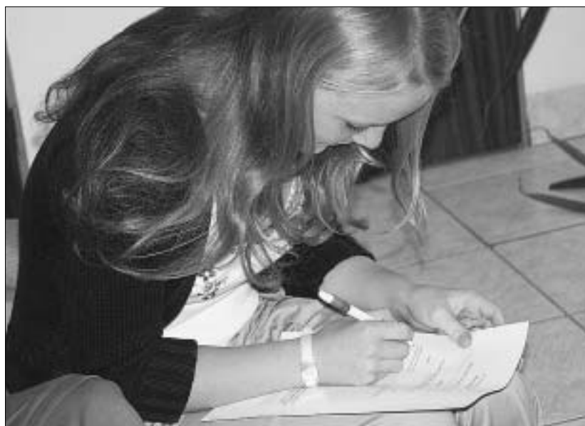
Sú či nie sú podľa vás Malacky dobrým miestom pre život? Nad touto otázkou si lámali hlavu Malačania. Odpovede si prečítajte pod titulkom Čo ukázala anketa?