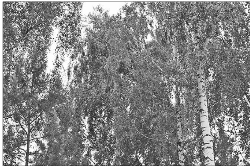
Koruny briez postupne zosychajú.