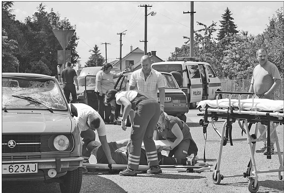
Vďaka novému projektu sa môže zvýšiť bezpečnosť na našich cestách.