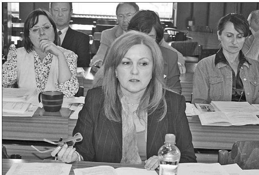
Mestské zastupiteľstvo schválilo zámer výstavby polyfunkčného domu na sídlisku Juh.