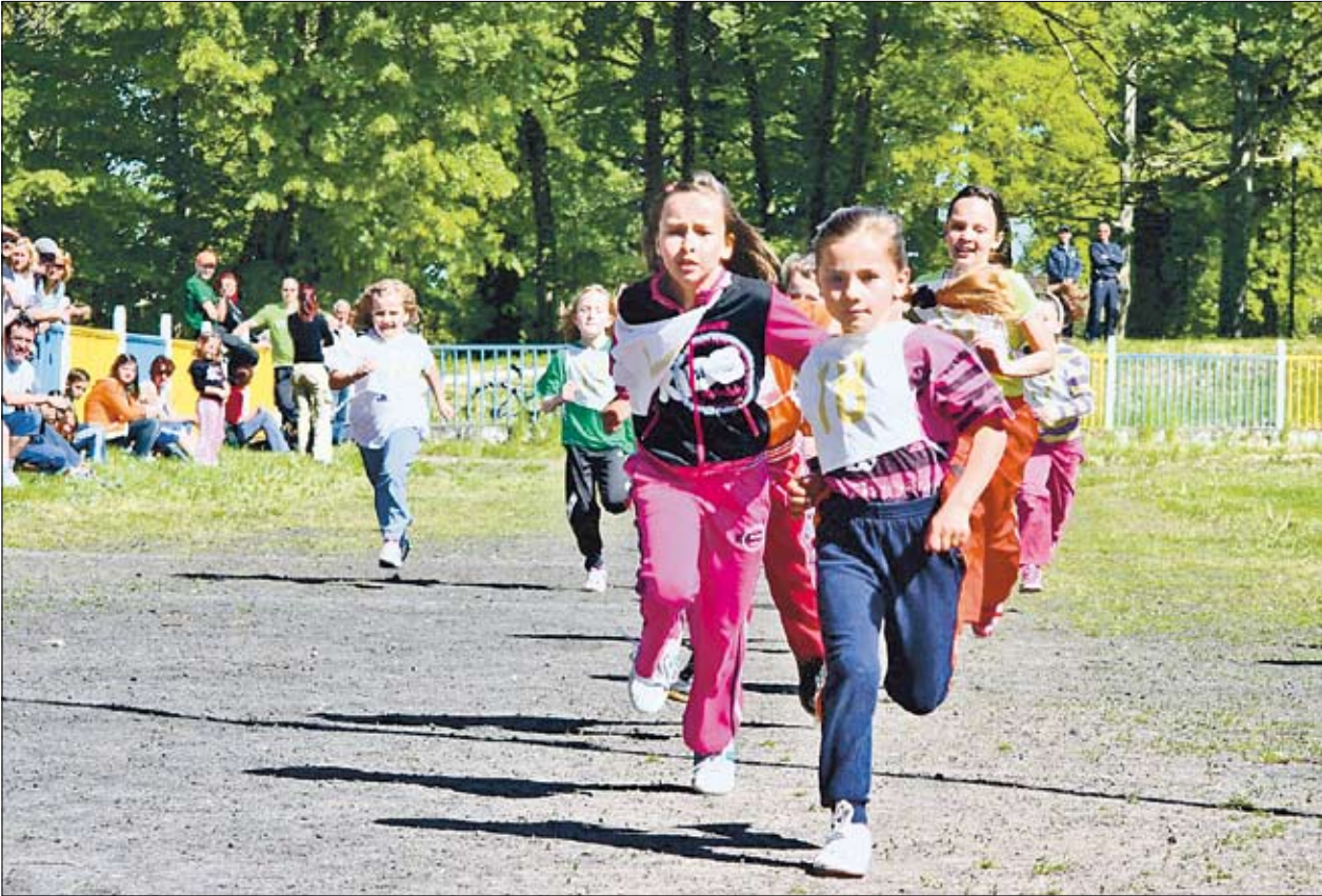
Aj tento rok boli účastníci hojne zastúpení vo všetkých kategóriách.