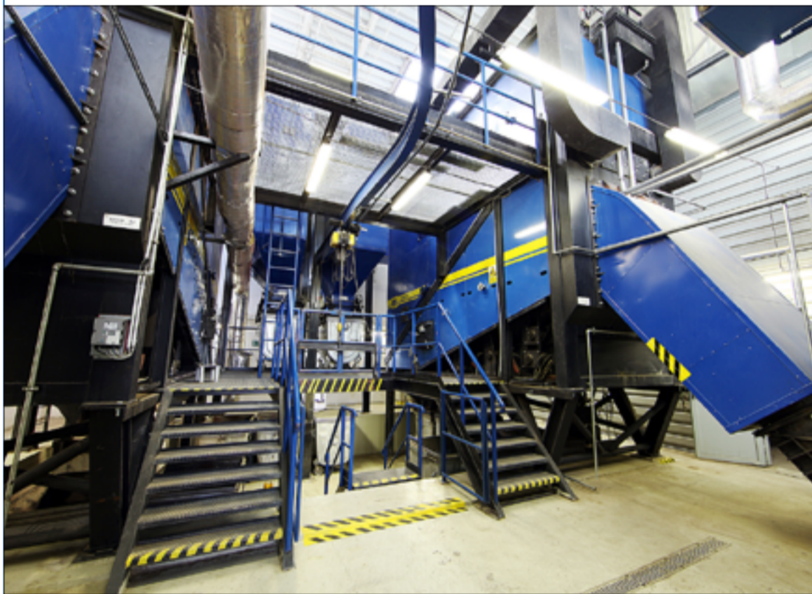
Platená inzercia – redakcia nezodpovedá za jej obsah.