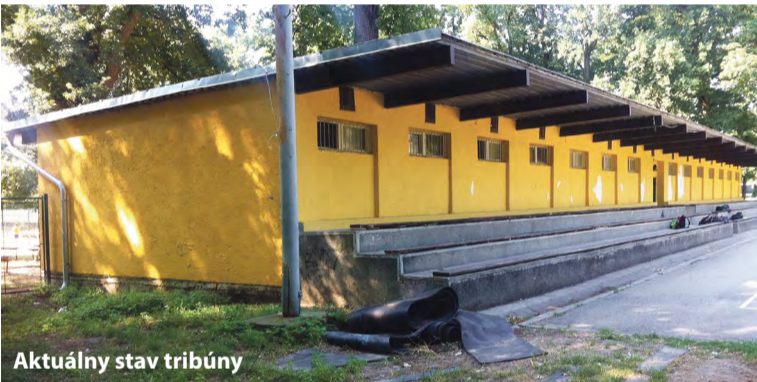
Aktuálny stav tribúny