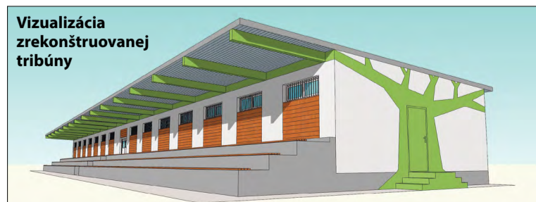
Vizualizácia zrekonštruovanej tribúny

Za rozhovor ďakuje Ľ. Pilzová Vizualizácia: Útvar strategického rozvoja MsÚ Malacky