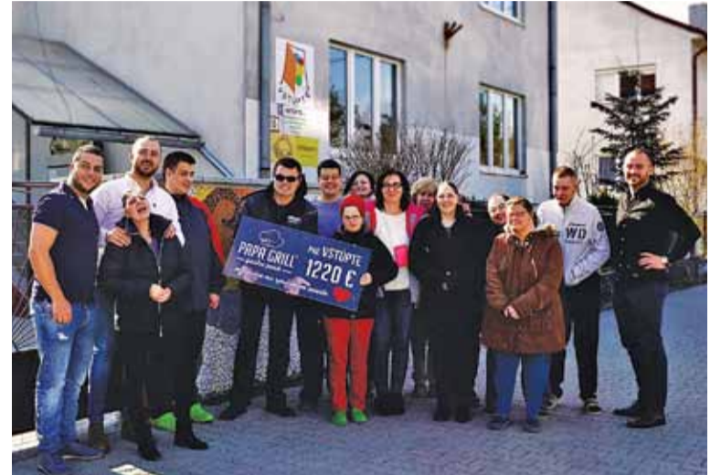
Platená inzercia, redakcia nezodpovedá za jej obsah.

Text: Lucia Vidanová, Vstúpte, n. o., foto: PAPA GRILL