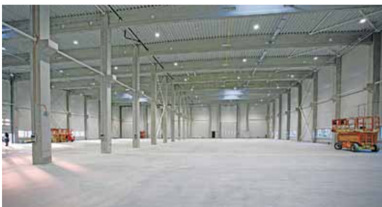
Platená inzercia. Redakcia nezodpovedá za jej obsah.