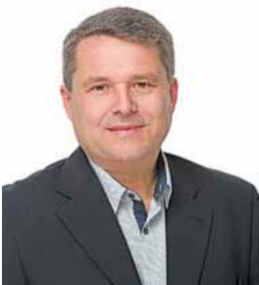
nezávislý poslanec IT špecialista

byť obrovským prínosom pre našich obyvateľov a rozhodne by mali estetickú, kultúrnu a celospoločenskú integritu. Zmenili by obraz mesta a vytvorili pešie a oddychové zóny, ktoré tu chýbajú. Rozhodne som presvedčená, že tento smer nastavenia pre rozvoj Malaciek je správny. Mojmým zámerom je podporiť ho a urobiť všetko pre to, aby aj široká verejnosť videla a pochopila túto snahu pre všetkých nás, čo tu bývame. Mesto sa hýbe, nestagnuje, a to je pre mňa spätná väzba, že mesto v súčasnom zložení jeho vedenia je v dobrých rukách. Spolupráca s verejnosťou, ako tomu je v mestských komisiách, je živým mechanizmom pre množstvo dobrých nápadov, ale zároveň je aj podporou a kontrolou, ktoré vnímate a rešpektujeme. Preto každý, kto má záujem, môže byť tvorcom dobrých vecí či konštruktívnym kritikom, a teda aj verejným činiteľom, akým je poslanec. Či podporím súčasné vedenie mesta ako verejný činiteľ alebo ako občan - táto cesta je pre mňa momentálne stále voľná.