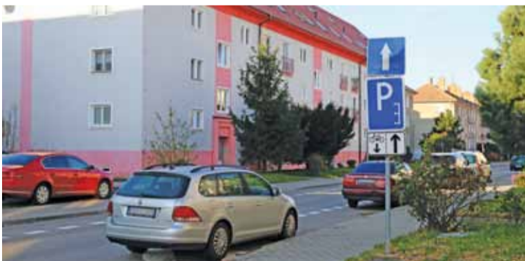
Ulica 1. mája