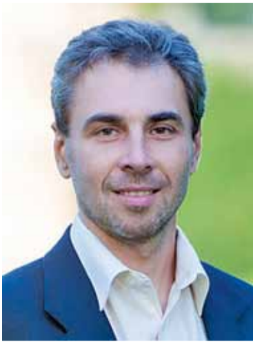
nezávislý poslanec pedagóg, zástupca riaditeľa Gymnázium Bilíkova, Bratislava