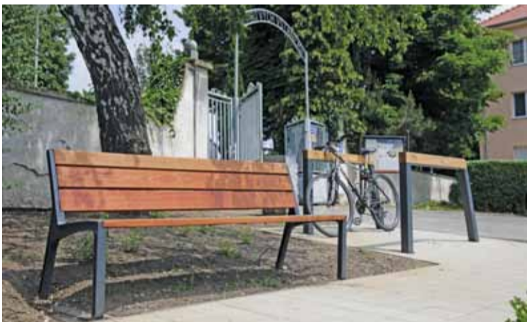
Vchod do starého cintorína

vo svojom obvode urobím v správnom čase, po dôkladnej analýze praxe dosiahnutých výsledkov, čo sa podarilo a nepodarilo... Úlohu zohrajú aj pracovné a rodinné povinnosti. Stále mám na srdci osud Malaciek, je to mesto, v ktorom som prežil celý svoj život, býva tu celá moja najbližšia rodina. Súčasné vedenie mesta má jasnú predstavu a víziu ďalšieho, aj strednodobého a dlhodobého rozvoja mesta. Pre každého angažovaného občana je tou byť pri tom, keď sa mení tvár mesta a Malacky sa stávajú krajšími a lepšími pre život. Ak by som pokračoval v práci poslanca, venoval by som sa naďalej oblasti vzdelávania, ale aj životného prostredia a sociálneho programu v meste.