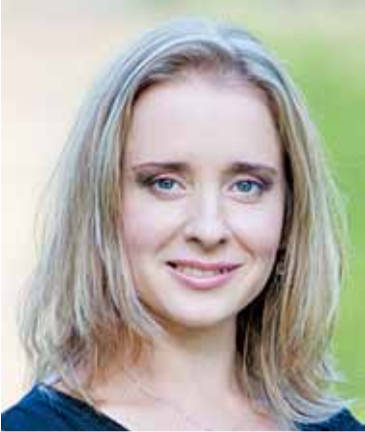
nezávislá poslankyňa pedagogička