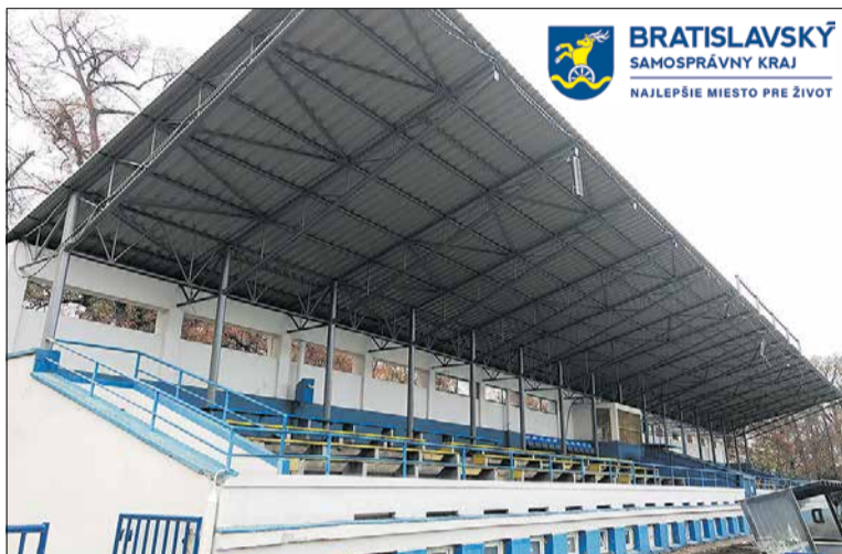
BRATISLAVSKÝ SAMOSPRÁVNÝ KRAJ NAJLEPŠIE MIESTO PRE ŽIVOT