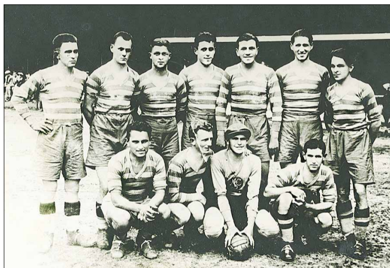
Futbalisti MŠC (MŠK)

vodne tri v presne určených termínoch. Neskôr sa z nich vyvinuli mesačné trhy, no pomenovanie jarmok zostalo. Termíny boli známe už v predchádzajúcom roku. Stanovovali sa tak, aby nekolidovali s termínmi jarmokov v blízkom okolí. Na jarmokoch v Malackách sa zišli predávajúci i kupujúci zo širokého okolia. Nielen Záhoráci, ale aj z okolia