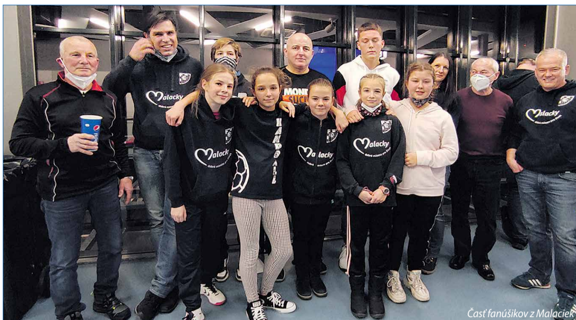
Časť fanúšikov z Malaciek