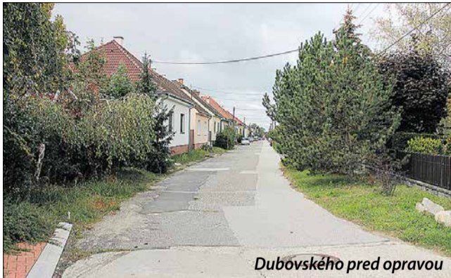
Dubovského pred opravou

Text: J. Hargaš