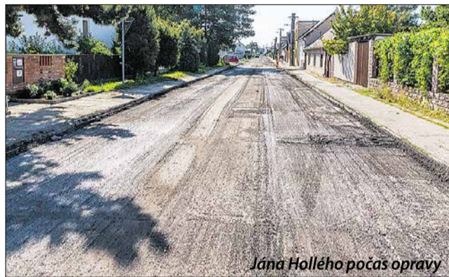
Jána Hollého počas opravy