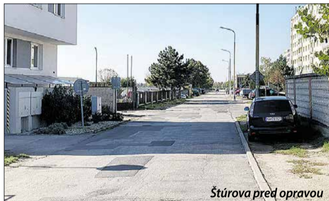
Štúrova pred opravou