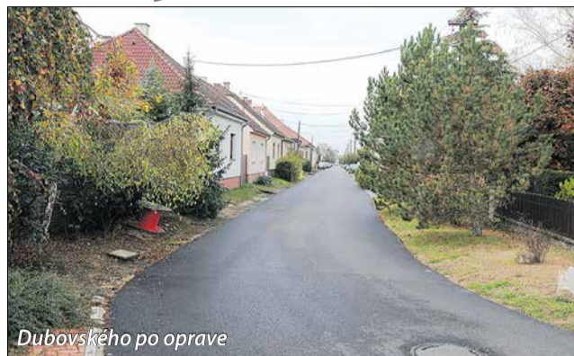
Dubovského po oprave