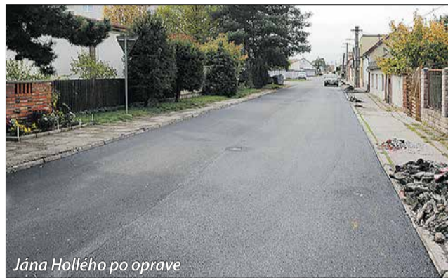
Jána Hollého po oprave