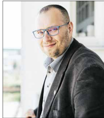
Text: -red-/TASR, foto: Trnavská univerzita v Trnave, Právnická fakulta

Poslaním verejného ochrancu práv (ombudsmana) je chrániť základné práva a slobody občanov pred orgánmi verejnej správy, teda napríklad úradmi, zdravotnou či Sociálnou poisťovňou. Úlohou ombudsmana je upozorňovať na porušovanie práv a žiadať o nápravu.