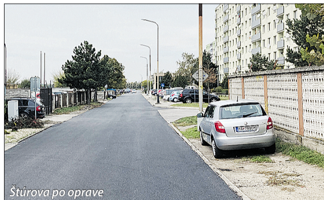
Štúrova po oprave