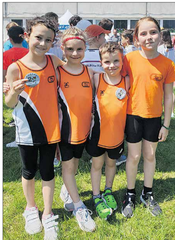
Mladšia prípravka AC Malacky – 2. miesto v Detskej P-T-S