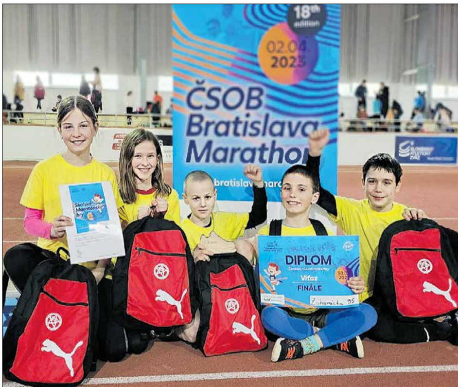
Školské maratónske hry – víťazný tím ZŠ Záhorácka