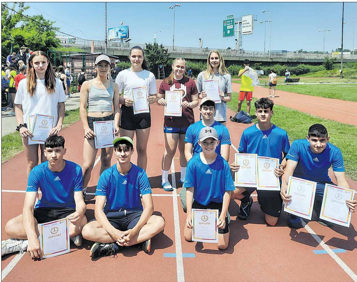
Vítazi krajského kola v atletike základných škôl – dievčatá ZŠ Dr. J. Déreka a chlapci ZŠ Záhorácka

V štvrtfinálovom kole Čokoládovej tretry Slovensko nazbierali čle-