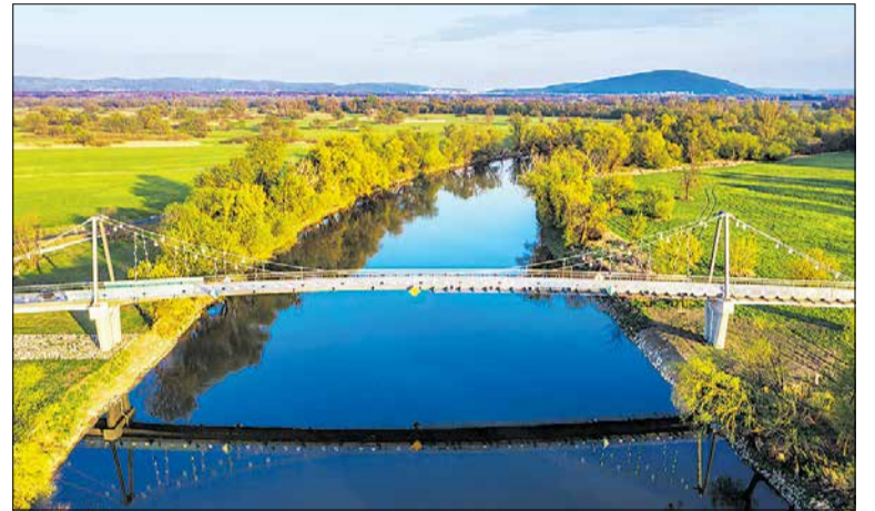
Cyklomost Vysomarch (Vysoká pri Morave – Marchegg)

Napríklad v Senci na Slnečných jazerách to už bolo viac ako 170-tisíc. Zaujímavé bude sledovať v budúcnosti tieto čísla napríklad v Malackách, kde mesto v poslednom období masívne investovalo do rozvoja cyklo-