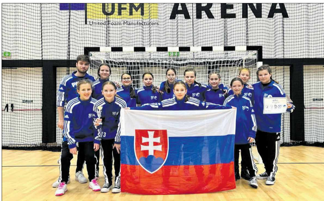
Mladšie žiačky na turnaji v Mosonmagyaróváru