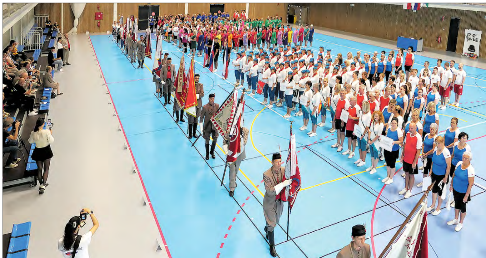
Župné sokolské slávnosti, Malacky 2025

V. Holčíka a M. Macejku a z článku Sokolská jednota v Malackách ( www.malackepohľady.sk ) spracovala L. Pilzová.