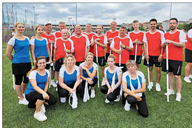
Všesokolský zlet, Praha 2024