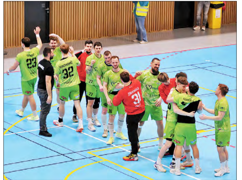
Zo zápasu extraligy v hádzanej HC Záhoráci – HC Sporta Hlohovec.

Hádzanári A tímu HC Záhoráci urobili dôležitý krok k záchrane v extralige. V domácom zápase proti Hlohovcu získali za výhru 32:28 tri body. Pred poslednými Topoľčanmi majú náskok troch bodov. „V tíme vládla skvelá energia a skvelú energiu nám dodávali aj fanúšikovia. Každý hráč dal zo seba sto percent a som naozaj spokojný s celým kádrom,“ zhodnotil zápas s Hlohovcom tréner B. Čirić.